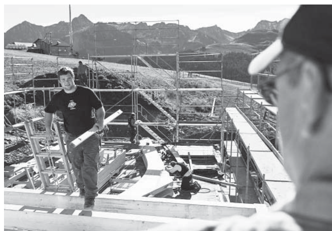
Schweizer Berghilfe/Yannick Andrea

Schweizer Berghilfe Aide Suisse aux Montagnards Aiuto Svizzero alla Montagna Agid Svizzer per la Muntogna